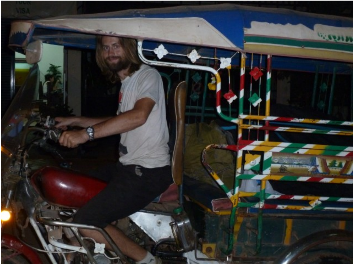
La seule photo de moi sur la bête!

Je roule tranquille, 20-25km/h environ, ce qui me fait penser que le vélo n'est pas moins rapide pour le moment. Je prends de l'essence, je redémarre sans problème puis m'arrête après 30km environ, en pensant que ça ne ferait pas de mal. Le tuk-tuk n'ayant pas de frein à main descend tout doucement dans un creux de l'accotement et ne redémarre plus... Il est 1h du matin et je passe alors une demi-heure avec un gamin de 10 ans à retirer le tuk-tuk sur la route, on est en nages! Ça ne redémarre toujours pas, je commence alors à m'allonger dans le hamac du tuk-tuk avant que d'autres locaux ne m'invitent à dormir sur une balancelle en bois où un coussin m'attendait.