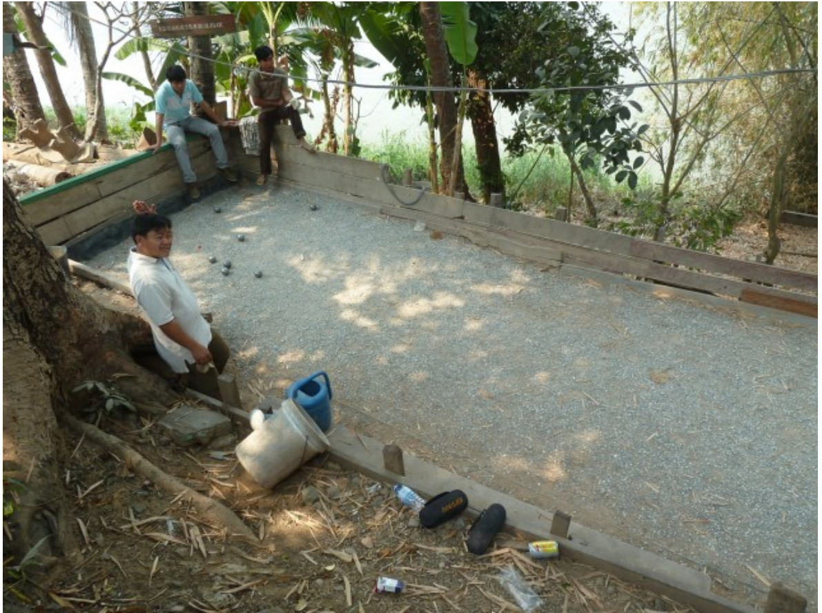
Remarquez qu'il est marqué "boules" sur les sacoches