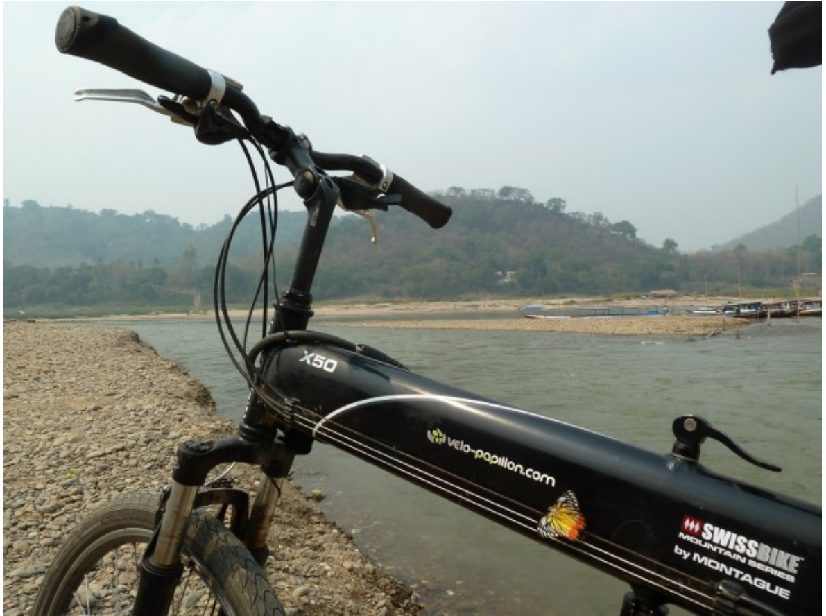
Une spéciale pour notre sponsor Vélo-papillon