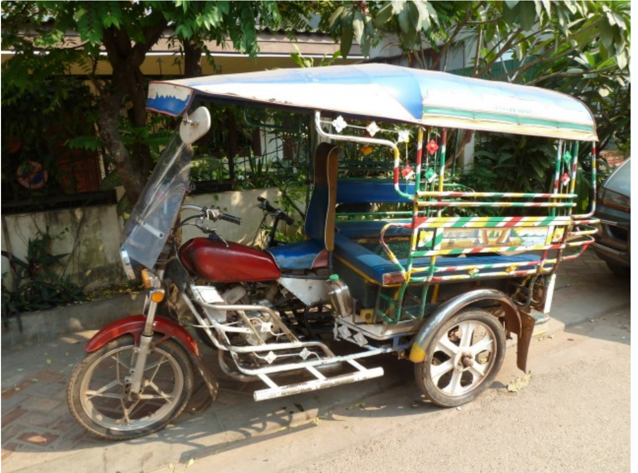
Avec le hamac en option Deluxe à l'arrière...