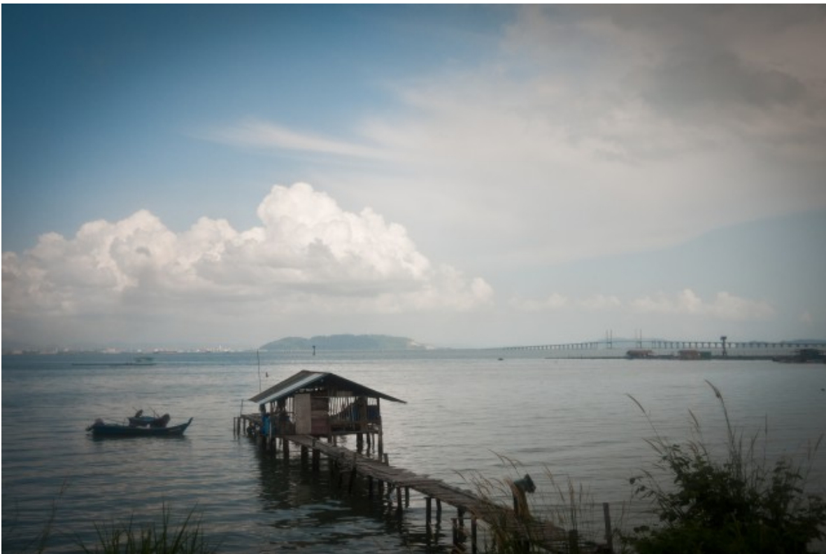
Le pont au fond à droite orne quelques billets malaisiens